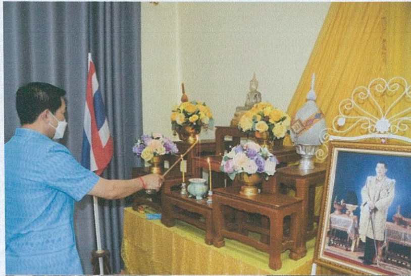
ผลการประชุมคณะกรรมการจัดการสิ่งปฏิภูมและมูลฝอยระดับเทศบาลตำบลปลัง